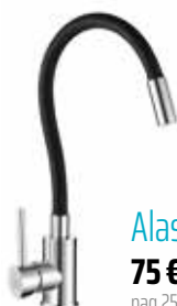
Alaska 75 € + IVA pag 257