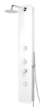
Tous 310 € + IVA AquaSingle pag 164