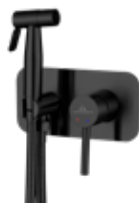
Akron NG Monomando 140 € + IVA pag 253