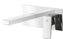
Nepal Monomando 120 € + IVA pag 252