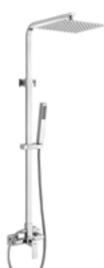
Luxor CR 230 € + IVA pag 46