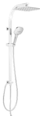
Córcega 160 € + IVA pag 124