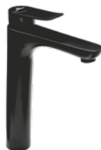
Grifo lavabo alto 115 € + IVA