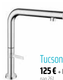
Tucson 125 € + IVA pag 261