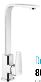
Denver 80 € + IVA pag 259