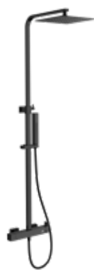
Grecia NG 285 € + IVA pag 22