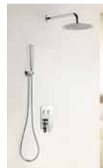
SET Málaga 02 Monomando 257 € + IVA pag 178