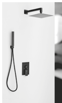
SET León NG Monomando 215 € + IVA pag 175