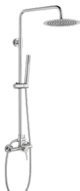
Exer 195 € + IVA pag 14