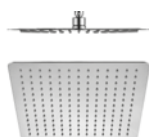
SERIE Sofía pag 186