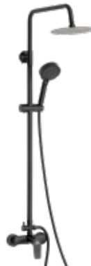
Sayro NG 185 € + IVA pag 76