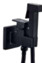
Iseo NG Monomando 136 € + IVA pag 254