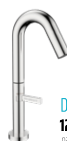
Dayton 120 € + IVA pag 261