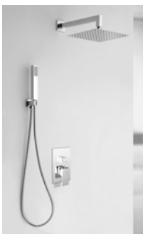
SET León CROMO Monomando 201 € + IVA pag 174