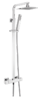
Tenerife 265 € + IVA pag 114