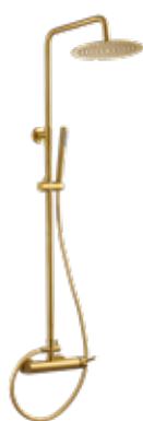
Like OT 310 € + IVA pag 44