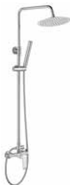
Misuri BL 185 € + IVA pag 64