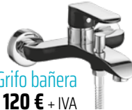
Grifo bañera 120 € + IVA