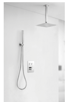
SET Sevilla 02 Termostático 262 € + IVA pag 179