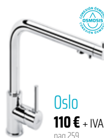
Oslo 110 € + IVA pag 259