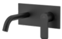
Kenia NG Monomando 125 € + IVA pag 248