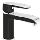
Grifo lavabo 70 € + IVA