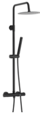
Neris 230 € + IVA pag 106