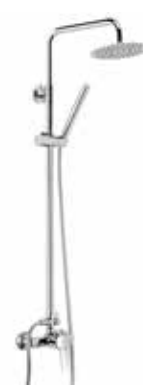
Mallorca 160 € + IVA pag 54