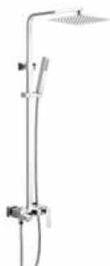
Mitra 280 € + IVA pag 68