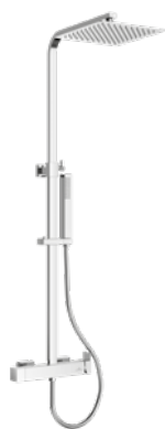
Grecia CR 250 € + IVA pag 18