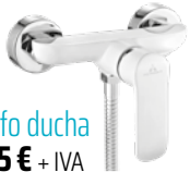
Grifo ducha 85 € + IVA