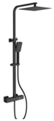
Terra 310 € + IVA pag 118