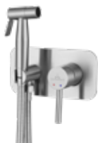
Akron AC Monomando 150 € + IVA pag 253