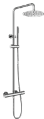
Inex 330 € + IVA pag 30