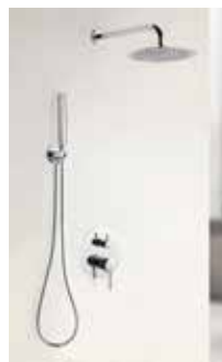
SET Sena CR Monomando 175 € + IVA pag 176