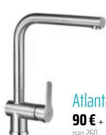
Atlanta 90 € + IVA pag 260