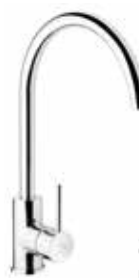
Kansas 80 € + IVA pag 258