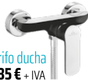
Grifo ducha 85 € + IVA