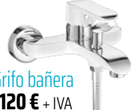
Grifo bañera 120 € + IVA