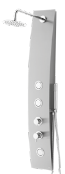
Yaris 310 € + IVA AquaSingle pag 168