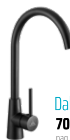
Dallas NG 70 € + IVA pag 258