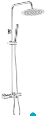
Bali 240 € + IVA pag 96