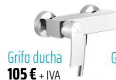
Grifo ducha 105 € + IVA