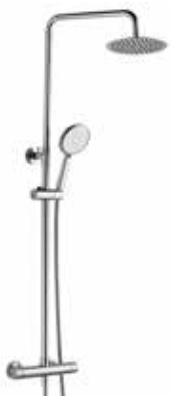
Vita 185 € + IVA pag 88