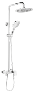
Divira 245 € + IVA pag 10