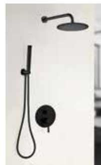
SET Sena NG Monomando 180 € + IVA pag 177