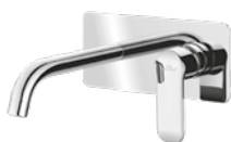
Kenia Monomando 110 € + IVA pag 248