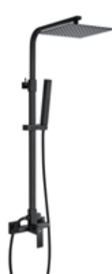
Luxor NG 260 € + IVA pag 50