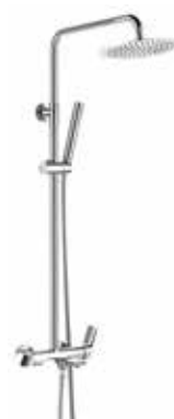
Tebas 305 € + IVA pag 84