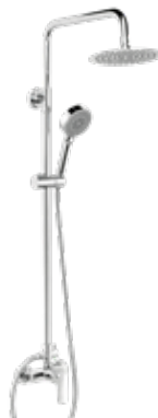
Sayro CR 145 € + IVA pag 72