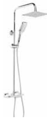
Oria 295 € + IVA pag 110