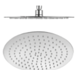
SERIE Moscú pag 186