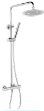
Iris 195 € + IVA pag 100