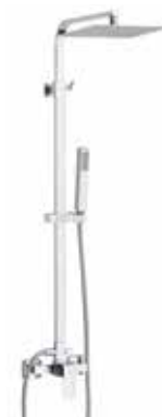
Seul 205 € + IVA pag 80