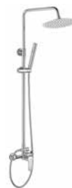
Misuri CR 175 € + IVA pag 58