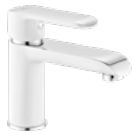
Grifo lavabo 70 € + IVA