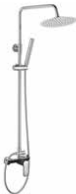
Misuri NG 185 € + IVA pag 66