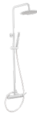
Like BL 235 € + IVA pag 38