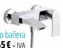
Grifo bañera 145 € + IVA