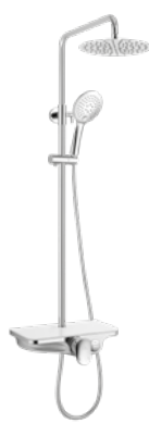
Indra 240 € + IVA pag 26