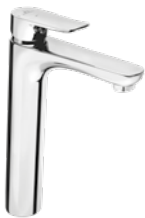
Grifo lavabo alto 110 € + IVA